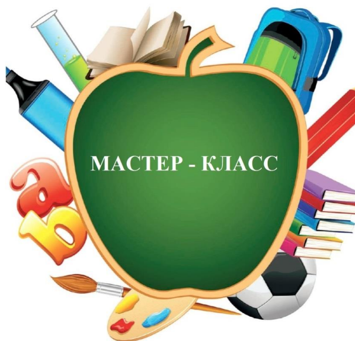
ГРАФИК ПРОВЕДЕНИЯ КОНКУРСНОГО ЗАДАНИЯ «Мастер – класс»

Дата проведения: 15.02.2016 г. (понедельник)