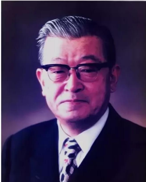
Dr. Kaoru Ishikawa